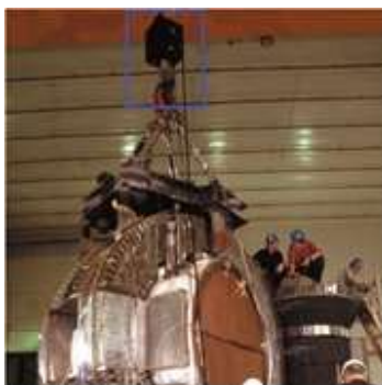
タービン部品はマイクロインチ精度で検査が可能