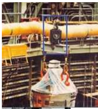
センシティブな原子炉の装着補助